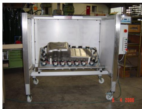
Dichtprüfstand DS 140 # 14855