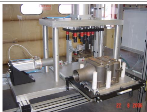
Prüfvorrichtung # 11494 in „Schubladenausführung“ für gute Zugänglichkeit